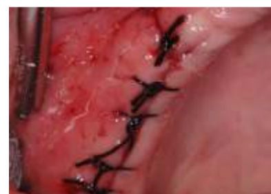
Cierre de la incisión