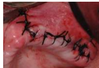
Cierre de la incisión