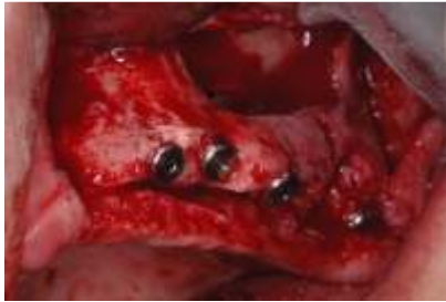
Apertura de la cavidad ósea con la elevación del seno maxilar y la colocación de cuatro implantes