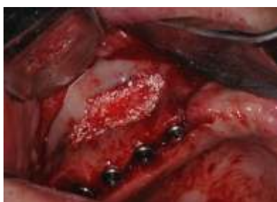
Remplissage de la cavité osseuse avec un matériau de greffe. Il n'y avait aucune fuite de biomatériau dans la membrane de Schneider