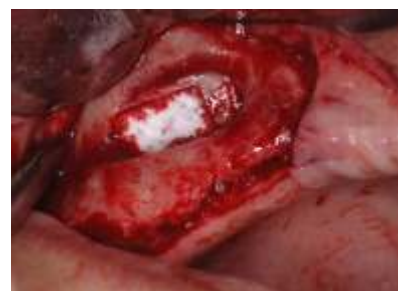
Etanchéité de la perforation avec l'utilisation du pansement collagène Hemospon Tape