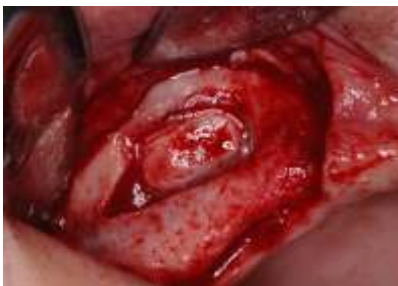
Cavité osseuse présentant petite perforation de la Schneider membrane