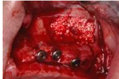
Placer le biomatériau avec PRP, comblement osseux de la cavité