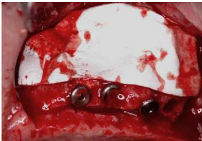
Confinement et protection des matériau de greffe avec le collagène vinaigrette Hemospon Tape